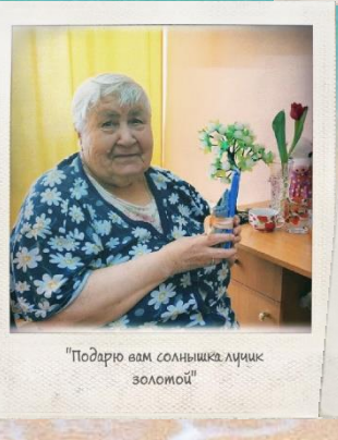
"Подарю вам солнышко лучик золотой"