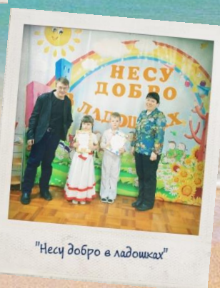
"Несу добро в ладошках"