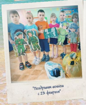
"Поздравим воинов с 23 февраля"